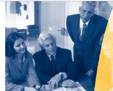
CONSULTING & IT