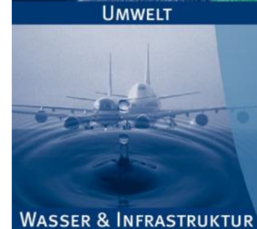
WASSER & INFRASTRUKTUR